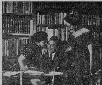
Don Adolfo López Mateos en familiar escena junto a su esposa e hija en la biblioteca de su residencia.

"La mujer será un ciudadano que labora por México; no debemos distinguirla del varón sino para honrarla más", dijo el candidato en el momento de su juramentación el recién pasado 17 de Noviembre